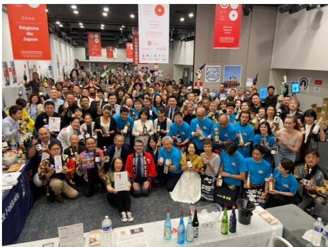
Salon du Saké 2023