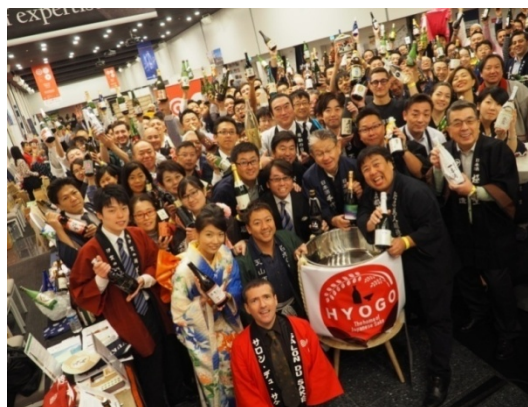
Salon du Saké 2018