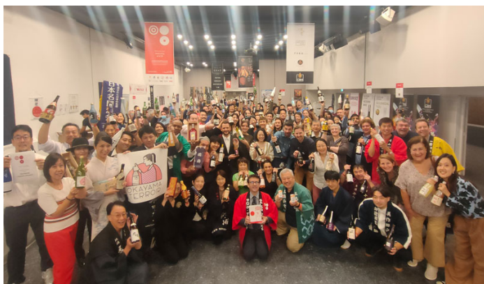
Salon du Saké 2022